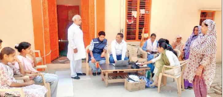
महेंद्रगढ़। मरीजों की जांच करते हुए।