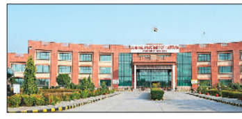
महेंद्रगढ़। हर्कति का भवन।

को अपना आशीर्वाद देंगे। कुलपति ने सभी अधिकारियों को निर्देश दिए हैं कि वे दीक्षांत समारोह के लिए सभी तैयारियां प्राथमिकता के आधार पर पूरा करें। कुलपति ने कहा कि गत वर्षों की तरह 12वां दीक्षांत समारोह भी भव्य होने वाला है। उन्होंने कहा कि दीक्षांत समारोह किसी भी शिक्षण संस्थान का सबसे महत्वपूर्ण अकादमिक कार्यक्रम होता है। यह