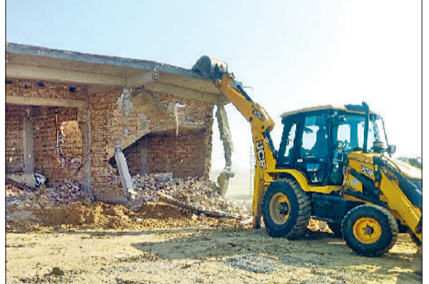
रेवाड़ी। अवैध दुकानों को तोड़ती जेसीबी।

पुलिस बल की मौजूदगी के चलते डीटीपी की इस कार्रवाई का कोई विरोध नहीं हुआ