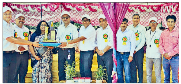
रेवाड़ी। प्रतियोगिता में अतिथियों का सम्मान करते आयोजक।

आएगा, आवाज बिल्कुल आपके बेटे, भाई या दोस्त की होगी और कहा जाएगा कि मेरा एक्सपोर्ट हो गया है या पुलिस ने पकड़ लिया है, तुरंत पैसे भेजो। वीडियो को पढ़ें आपको किसी परिचित का चेहरा दिखेगा, जिससे आप बिना शक किए पैसे ट्रांसफर कर देंगे। वही पहनकर अपराधी वीडियो कॉल करेंगे और कहेंगे कि आपके नाम से ड्रम पकड़ी गई है, आप घर में कैद हैं।