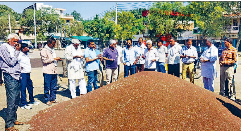
रेवाड़ी। अनाजमंडी में नई सरसों की बोली लगाते हुए व्यापारी।