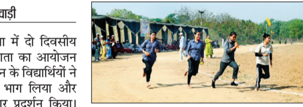
रेवाड़ी। रिले रेस में भाग लेती छात्राएं।