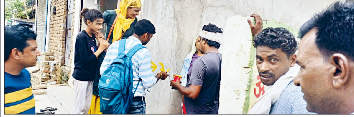
रेवाड़ी। पैमाइश के बाद जमीन की निशानदेही करते हुए कर्मचारियों का फाइनल फोटो तथा राजस्व रिकॉर्ड की फर्द का फोटो।