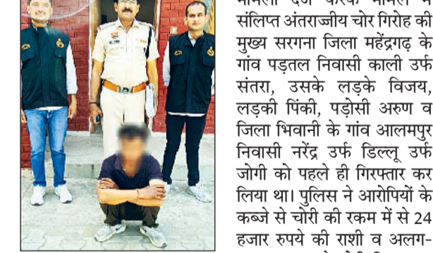
रेवाड़ी। पुलिस गिरफ्त में आरोपी।