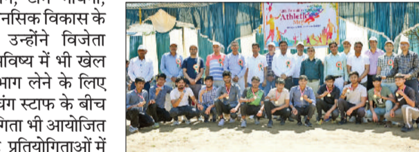
रेवाड़ी। विजेताओं को पुरस्कार करते हुए अतिथि।

प्रतियोगिताओं में प्रथम, द्वितीय व तृतीय स्थान के विजेता प्रतिभागियों को पुरस्कार एवं प्रमाण-पत्र देकर सम्मानित किया गया।