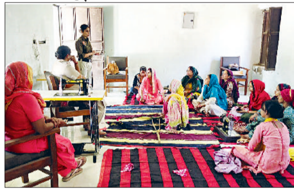
पानीपत। महिलाओं को जानकारी देते हुए दुर्गा शक्ति टीम।

दुर्गा शक्ति विंग ने महिलाओं को विभिन्न अपराधों, बचाव व नशे के दुष्प्रभावों के बारे में दी जानकारी हरिभूमि न्यूज़ ▶▶▶ रेवाड़ी