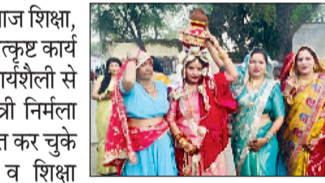
रेवाड़ी। कुआं पूजन करते हुए कुआं पूजारी।