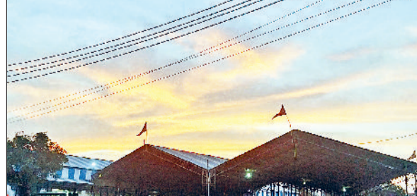
रेवाड़ी। सोमवार रात को बारिश के बाद छाने के बाद का दृश्य।

लेकिन अभी बारिश के आसार नजर नहीं आ रहे हैं। मंगवार को सुबह से ही आसमान साफ बना रहा। तेज धूप निकलते ही दोपहर तक गर्मी ने जमकर पसीने छुड़ाए। अधिकतम तापमान 1.0 डिग्री सेल्सियस बढ़कर 37.0 डिग्री पर पहुंच गया, जो इस सीजन में दिन का सर्वाधिक तापमान है। रात का तापमान 0.2 डिग्री की कमी के साथ 14.2 डिग्री सेल्सियस दर्ज किया गया। इस समय दिन-रात के तापमान सामान्य से अधिक बने हुए हैं। बीत साल 10 मार्च को अधिकतम तापमान 31.5 डिग्री