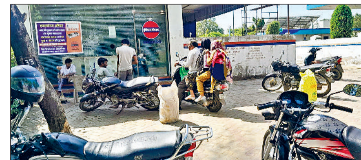
रेवाड़ी। गैस एजेंसी पर सिलेंडर लेने के लिए खड़े लोग।